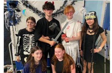
Hwyl Disgo Calan Gaeaf 2024!

Wrth i ni nesáu at ddiwedd ein hanner tymor cyntaf, hoffwn nodi ein diolch diffuant am waith rhagorol disgyblion a staff ar ddechrau prysur a chynhyrchiol i'r flwyddyn academaidd. Mae eisoes wedi bod yn fwrwm o weithgaredd - digwyddiadau codi arian, ymweliadau addysgol, gweithdai lles yn ogystal â gweithgaredd chwaraeon a chlybiau allgyrsiol. Diolch yn fawr i elusen Dangos Cerdyn Coch i Hiliaeth am ddarparu gweithdai addysgol pwysig i'n disgyblion B17, gan hyrwyddo cydraddoldeb a brwydro yn erbyn rhagfarn yn ein cymuned.