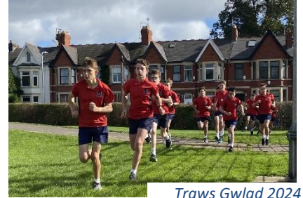
Traws Gwlad 2024

Wythnosau cyntaf prysur! Rydym wedi mwynhau pythefnos prysur gyda myfyrwyr yn ymgartrefu'n dda i fywyd bob dydd yng Nglantaf. Roedd hefyd yn dda gweld y lefelau gwyh o gyfranogiad, mwynhad ac egni yn ein ras Traws Gwlad flynyddol yr wythnos hon!