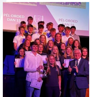
Noson Wobrwyo Chwaraeon 2024