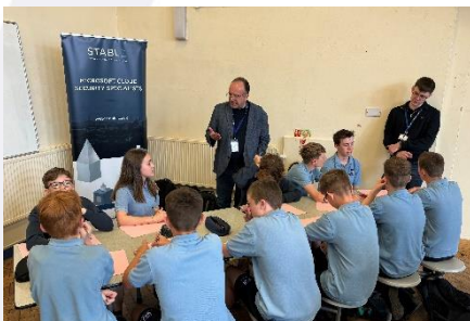
B8 yn sgwrsio gyda'r Fforwm Busnes

Prosiect Pentref – Fforwm Busnes Blwyddyn 8: Mae BI8 wedi dechrau ar eu tasg o gynllunio adeilad ar gyfer Pentref Taf . Mae wir wedi bod yn hyfryd gweld brwdfrydedd a chreadigrwydd ar waith wrth iddyn nhw gydweithio mewn grwpiau. Rydym yn edrych ymlaen at weld cyflwyniadau pob grŵp Dydd Gwener - 14/6/24, pan fydd disgyblion yn cyflwyno i banel allanol o gwmnïoedd gwahanol. Hoffwn ddiolch i'r cwmnïoedd am eu holl gymorth gyda cyflwyno'r dasg yma i flwyddyn 8. Cwmnïoedd - Willmott Dixon, Pepper Money, Stable, Ty'r Cwmnïau, Cardiff Commitment, ISG Construction, Kier Construction, Prifysgol