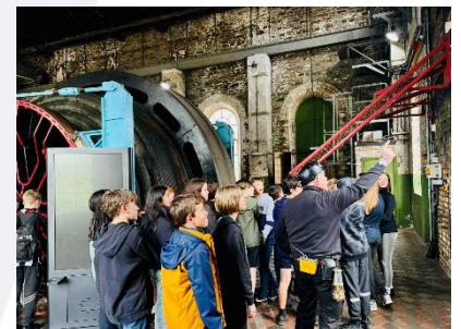
Taith i Barc Treftadaeth y Rhondda

Taith i Barc Treftadaeth y Rhondda: Mae Blwyddyn 7, fel rhan o'u gwersi Cymraeg/Coron Gwlad, yn mynychu ymweliad addysgol ag Amgueddfa Parc Treftadaeth Cwm Rhondda yn ystod mis Mai. Mae'r profiad mwyngloddio Cymreig hwn yn gysylltiedig â'r gwaith y maent yn ei ddysgu yn eu gwersi. Maent yn astudio "Pwll i Borthladd", gan ddechrau gyda'r daith hon, ac yn gorffen gydag ymweliad â Bae Caerdydd ar ddiwedd y flwyddyn. Mae'r daith i Amgueddfa Parc Treftadaeth Cwm Rhondda yn cynnwys tair gweithgaredd, sef Taith yr Aur Du, Taith Gerdded ar Lwybr y Dramffordd, a chasglu ffeithiau diddorol yn yr Arddangosfa.