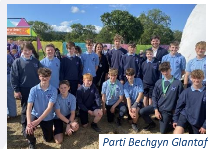
Parti Bechgyn Glantaf