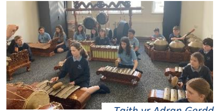
Taith yr Adran Gerdd

Taith yr Adran Gerdd: Mynychodd rhai o ddisgyblion iau'r ysgol Weithdy Cerdd gyda Gamelan ar ddechrau'r wythnos diwethaf yn Nghanolfan y Chapter. Cyfle oedd hyn i arbrofi gydag offerynnau newydd a phrofi cerddoriaeth draddodiadol o Indonesia.