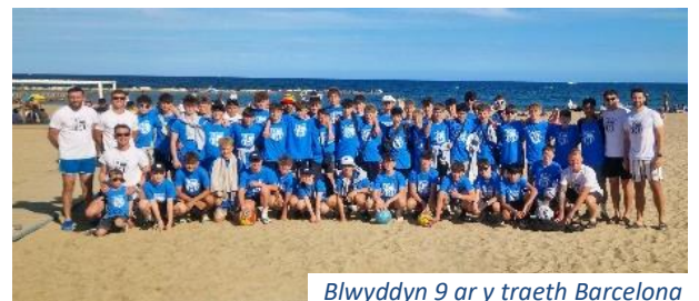
Blwyddyn 9 ar y traeth Barcelona

Taith bêl droed BI9 i Barcelona: Roedd yr adran Addysg Gorfforol yn llawn canmoliaeth am ymddygiad, cwrteisi a Chymreictod grŵp o ddisgyblion blwyddyn 9 a fynychodd daith pêl droed i Barcelona dros y Sulgwyn. Fe aethon nhw i weld y Stadiwm Olympaidd, ar lan y môr ym Marcelona a hefyd Eglwys anhygoel y Sagrada Familia. Enillion nhw 2 allan o 3 gem yn ogystal – da iawn fechgyn!