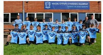
Blwyddyn 7 ar ei ffordd i Wembley!

Wembley: Am yr ail dro yn hanes yr ysgol llwyddodd ein tîm rygbi gynghrair blwyddyn 7 i gyrraedd rownd derfynol Cwpan Prydain Fawr. Chwaraeodd y tîm ar Wembley ar yr 8fed o Fehefin – profiad arbennig. Er colli oedd hanes y rownd derfynol yn erbyn tîm cryf St Peters o Wigan, roedd cyrraedd mor bell yn dipyn o gamp, ac yn brofiad bythgofiadwy i'r disgyblion.